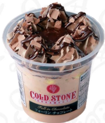
フォーリンチョコ レート