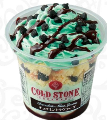
チョコミントラヴァーズ