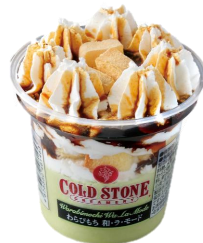
山梨 信玄餅アイス