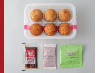
えびたこミックス