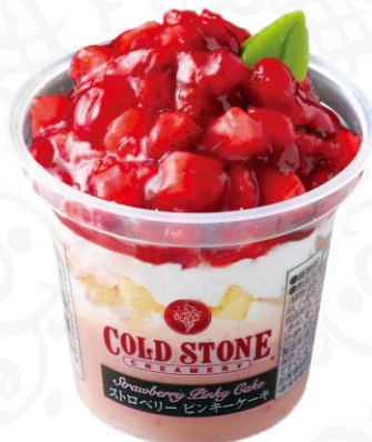
ストロベリーピンキー ケーキ