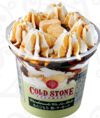
わらびもち 和・ラ・ モード