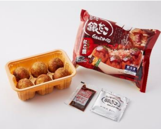
定番ソース たこ焼