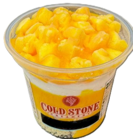
宮崎 マンゴーアイス