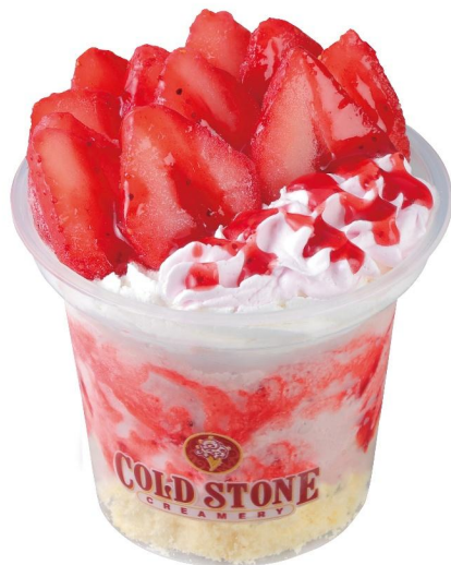
福岡 あまおうアイス