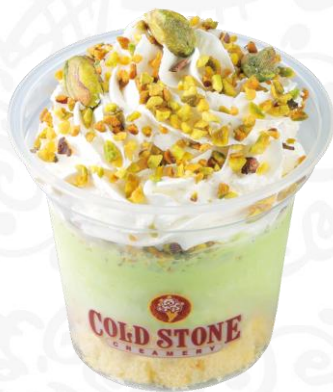
ナッティ・バディ ピスタチオ