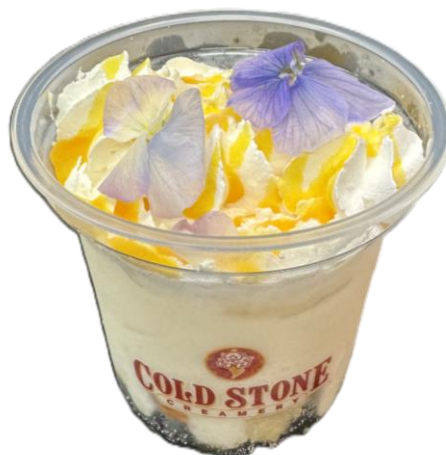
沖縄 エプリルフラワーアイス